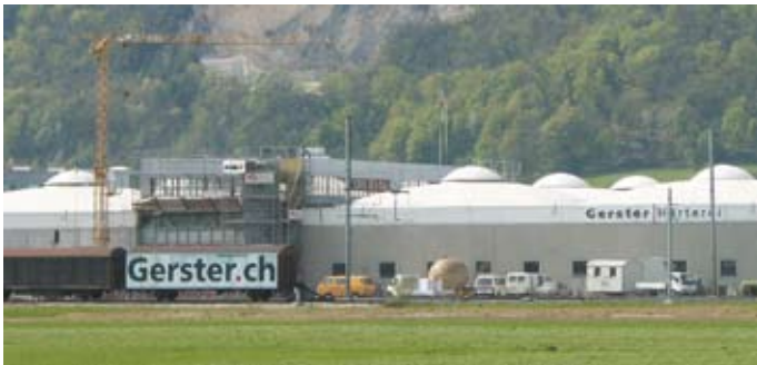
■ Härterei Gerster AG

Um neuen Platz zu schaffen erweitert die Härterei Gerster AG in Egerkingen Ihren Firmensitz in einem ersten Schritt mit einem Zwischentrakt für allgemeine Nutzungen. Anschließend wird auf das bestehende Verwaltungsgebäude ein zusätzliches Stockwerk für weitere Büroräume aufgebaut.