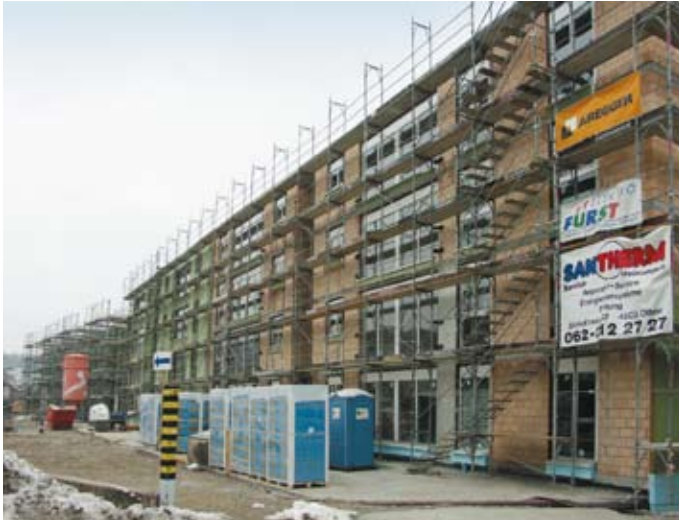
■ Mehrfamilienhaus am Altmattweg in Olten

Idyllisch gelegen, mit wunderbarer Aussicht auf den Born und bis ins Gäu, erstellt die Oltner Oltra AG am Altmattweg in Olten 32 Mietwohnungen. Die ruhige Lage direkt an der Dünnern, die hellen und großzügigen Wohnungen sowie die Nähe zum Stadtzentrum, lassen das Herz jedes Mietinteressenten höher schlagen.