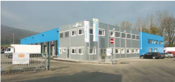
■ Keepcool Transport AG